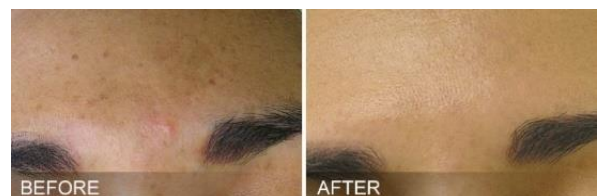
シミ 4回トリートメント後