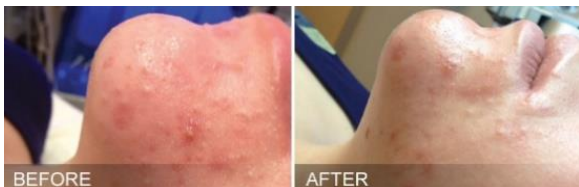
ニキビ+オイリー肌 1回トリートメント後 (トリートメント後1時間)